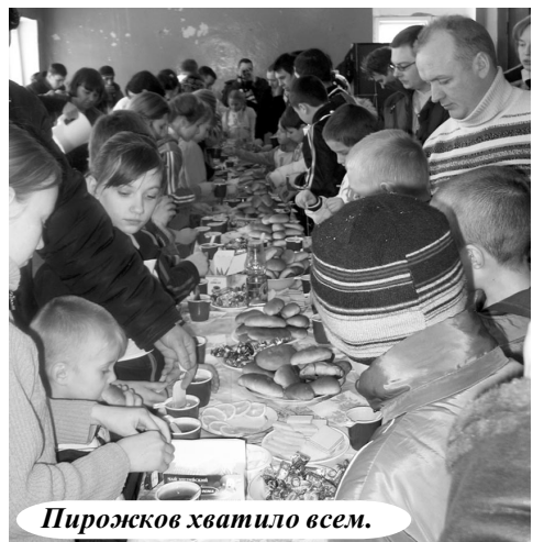
Пирожков хватило всем.