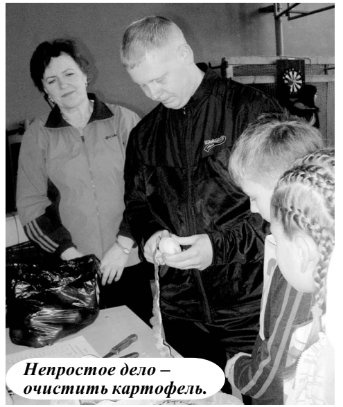
Непростое дело – очистить картофель.