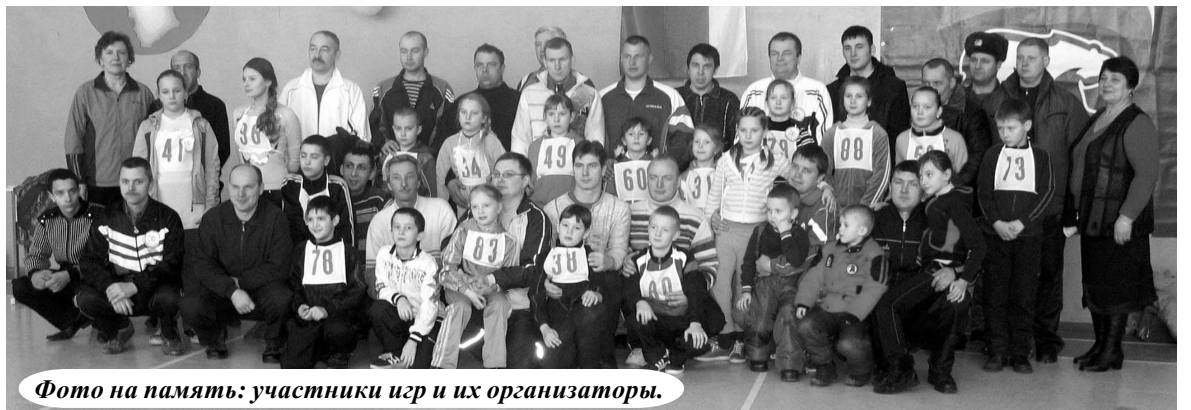
Фото на память: участники игр и их организаторы.

Хочу отметить, что хотя основа и сохраняется, организаторы каждый раз стараются внести в конкурсы что-то новое. Так получилось и с эстафетой. Помимо привычного бега с мячом, забрасывания его в